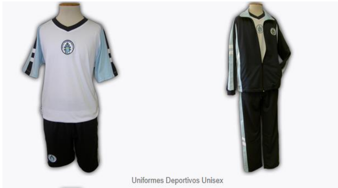
Uniformes Deportivos Unisex